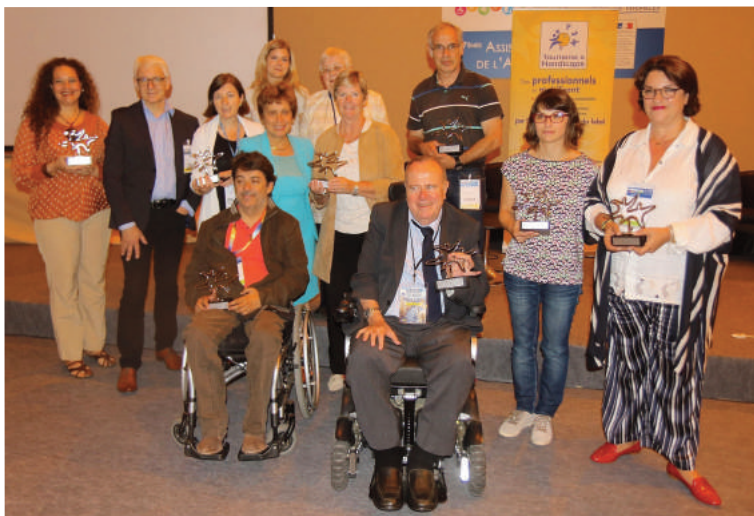
Légendes de la photo :

Les prochains Trophées seront remis à Lyon en juin 2017, dans le cadre du salon HANDICA.